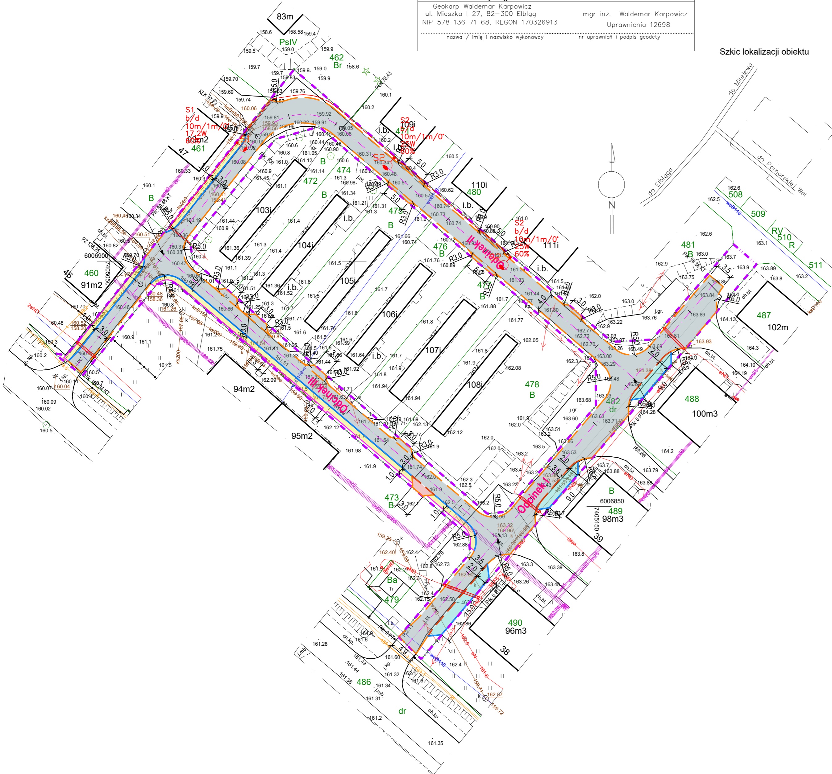
Szkic lokalizacji obiektu