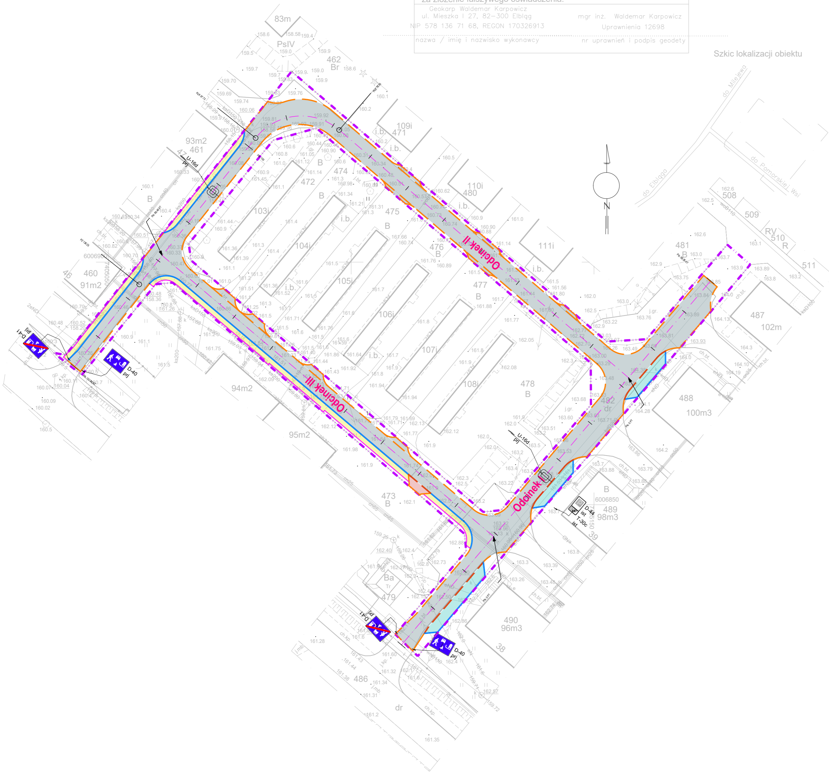
Szkic lokalizacji obiektu